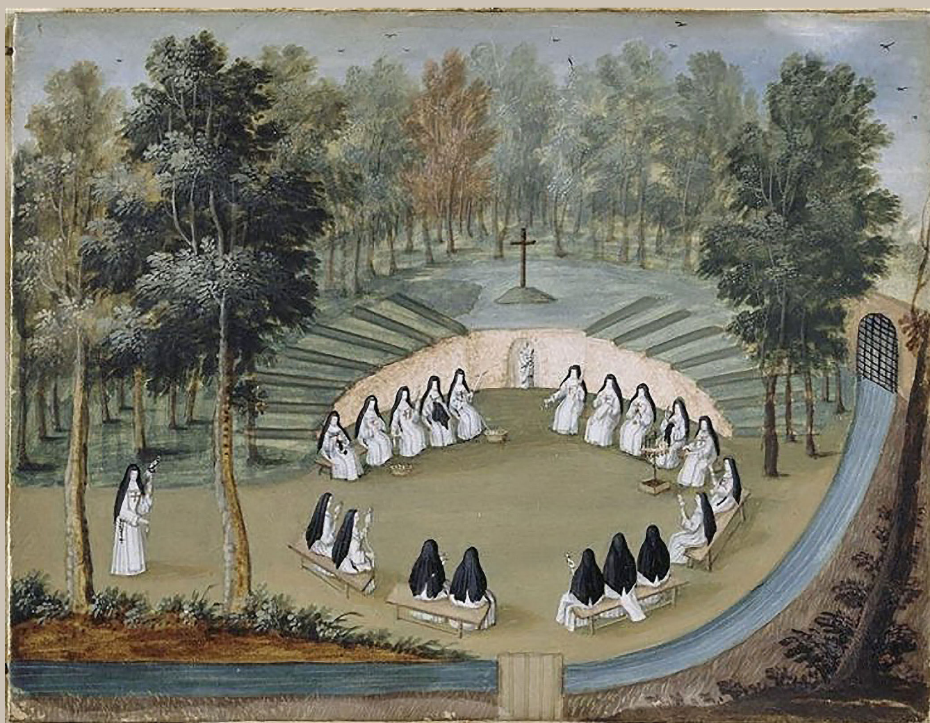
Solitude de Port-Royal des Champs, 1709, Louise-Madeleine Hortemels, Louvre Collections

Colloque international Lyon, 14 et 15 novembre 2024