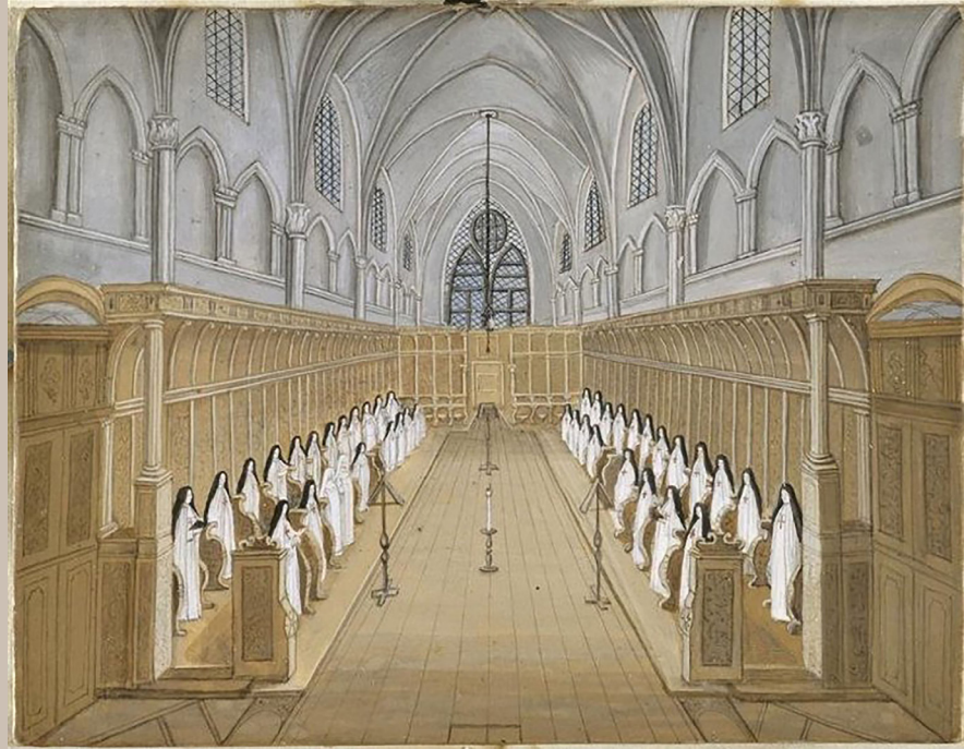
Chœur des religieuses à Port-Royal des Champs, 1709, Louise-Madeleine Hortemels, Louvre Collections