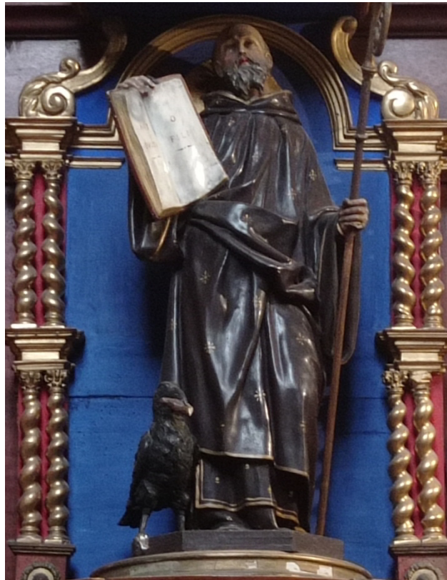
Autel de Saint-Benoît, abbaye de Hautecombe, Détail : saint Benoît présentant la Règle « Obsculta, o fili, praecepta magistri »