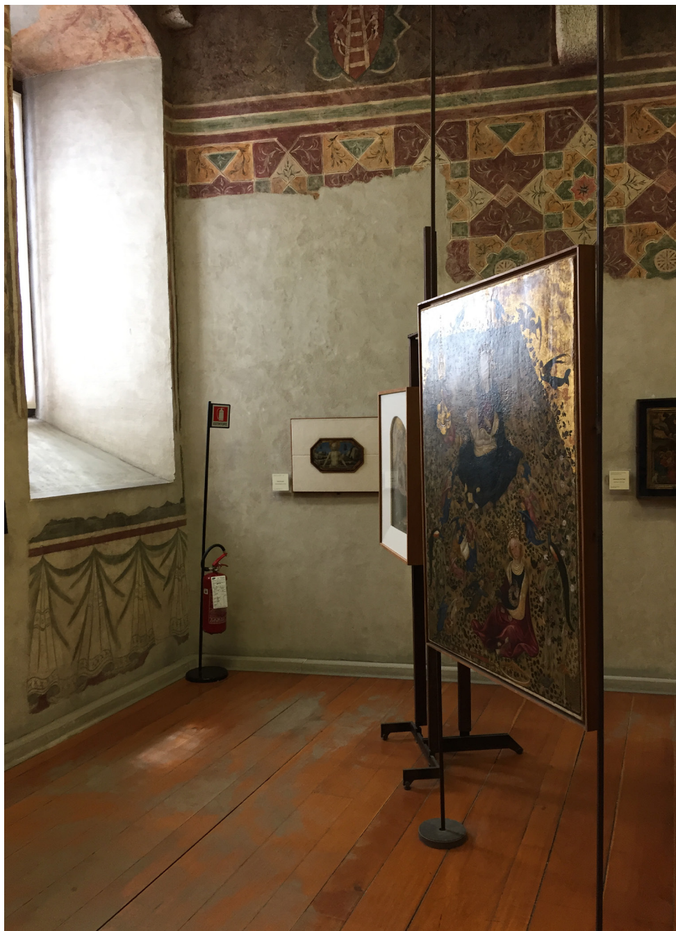
Carlo Scarpa, Muséographie du musée de Castelvechio (Vérone, Italie), 2021